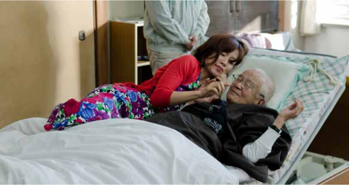
老化失智死亡倡議，日本。