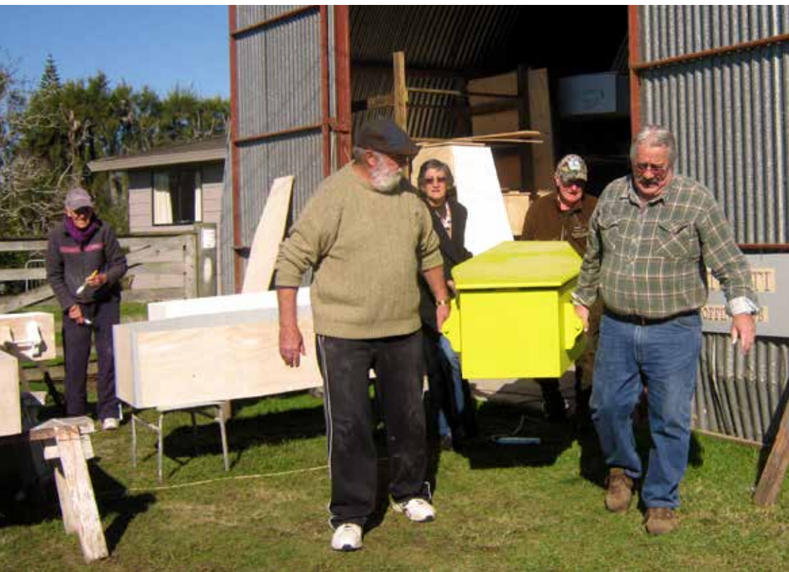
紐西蘭奇異棺材俱樂部