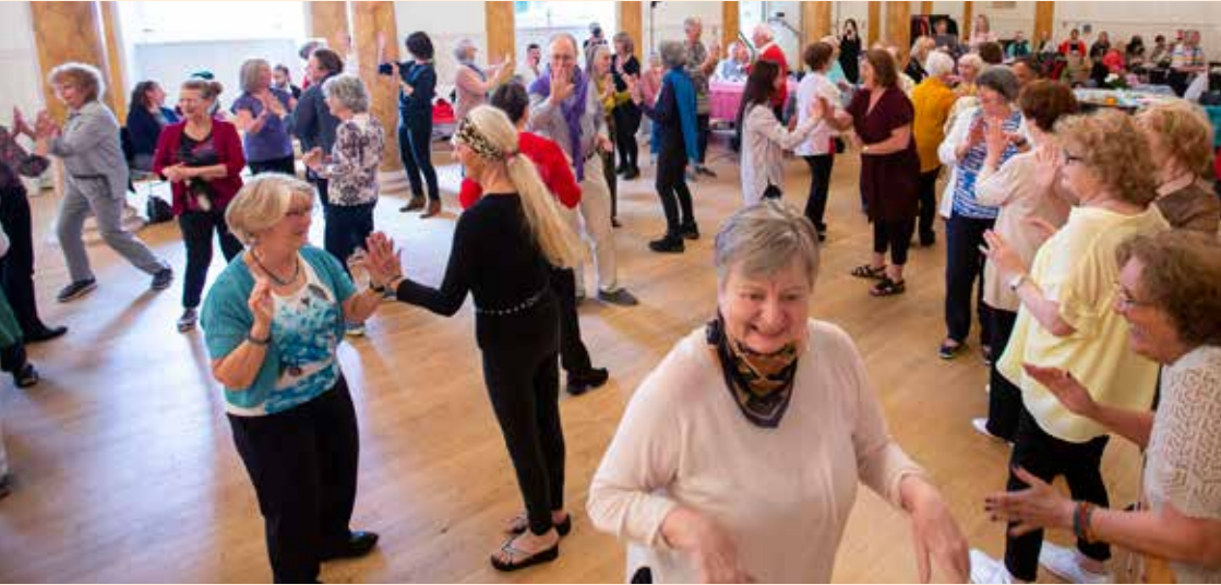
地板舞動-由步伐舞團製作的貝爾丹藝術節舞蹈活動，活動攝影。2019/2020。

愛爾蘭社會老年學中心 (Irish Centre for Social Gerontology) 在2009公開一份針對貝爾丹藝術節的研究，研究結果相當正面。研究指出「不管是全國或地方，藝術節都對藝術實務創造深遠、顯而易見的影響。」