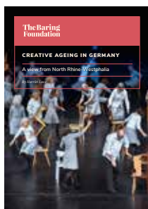
Creative ageing in Germany: the view from North Rhine-Westphalia Harriet Lowe 2017