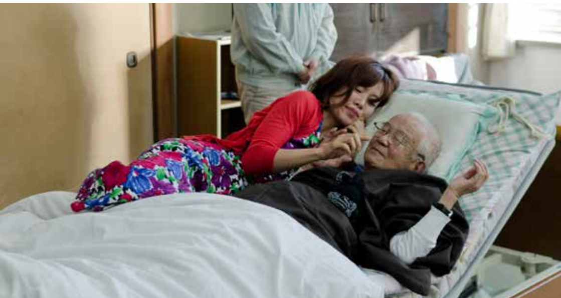
老化認知障礙死亡倡議，日本。