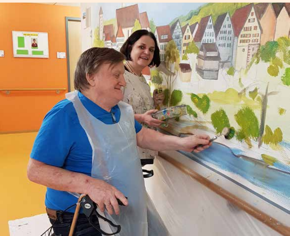
照護藝術計劃。

創意高齡與融合藝術能力中心亦有推廣資訊交流及優質的做法。舉例來說，舉辦「行動日」這樣的活動，讓獲得經費資助的計劃執行者齊聚一堂，介紹自己的計劃內容並交流想法。行之有年的黃金劇團 (Theatre Gold) 計劃更替北威邦的高齡劇團舉辦狂野西德 (WILDwest) 雙年戲劇節，其中包含戲劇製作、工作坊和研討會等活動。其官方網站整理了高齡族群或專業人士參加的活動日程表；設計精美的雜誌中刊登許多具有啟發性的案例作為參考。